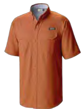
849 DESERT ORANGE