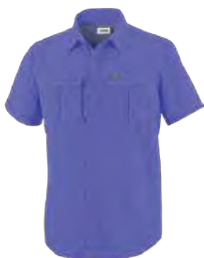
543 VIOLETA SEA