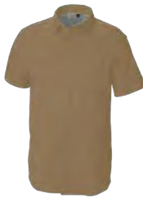
743 CANYON SUN