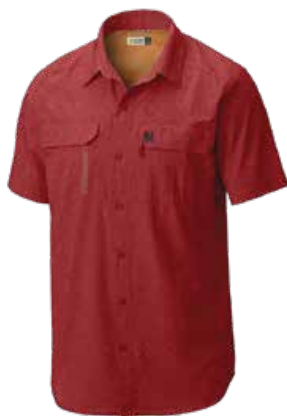
849 WARP RED