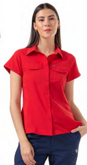
WARP RED 849