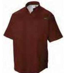
622 RED LILY