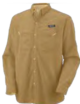
743 CANYON SUN