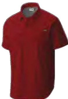
● 849 WARP RED