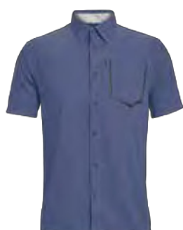
543 VIOLETA SEA