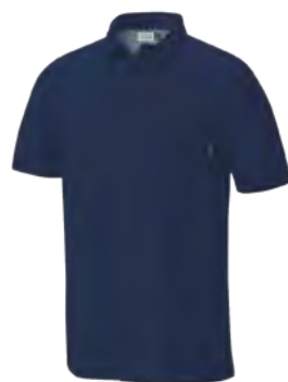
534 DEMIN BLUE