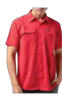
622 DARK MOUNTAIN