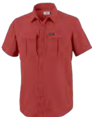
683 SUNSET RED