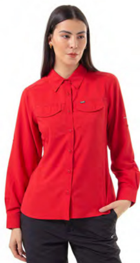
WARP RED 849