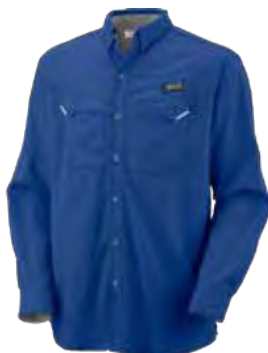
534 DEMIN BLUE