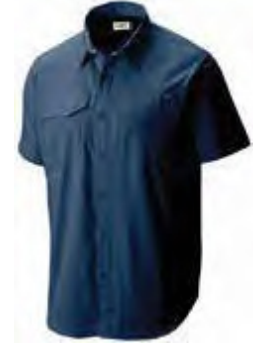
534 DEMIN BLUE