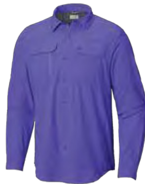
543 VIOLETA SEA

Ligera, técnico, Transpirable y su ventilación aerodinámica, Canaima Shirt te mantendrá Cómodo en todas tus Aventuras.