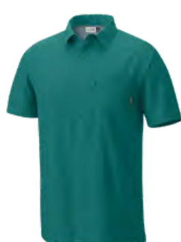
329 TRANQUIL TEAL