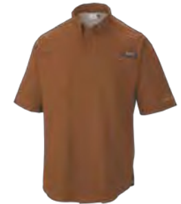
849 DESERT ORANGE