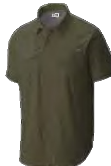
● 397 STONE GREEN