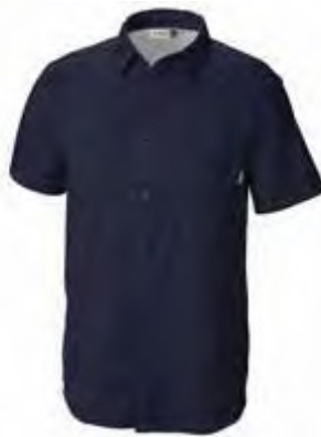
534 DEMIN BLUE