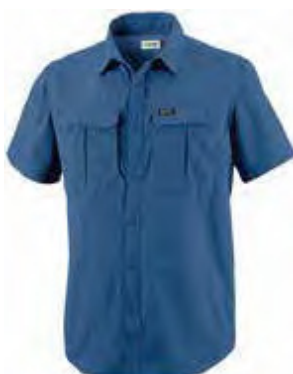
534 DEMIN BLUE