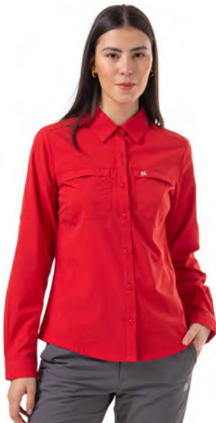
WARP RED 849