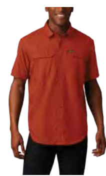
683 SUNSET RED