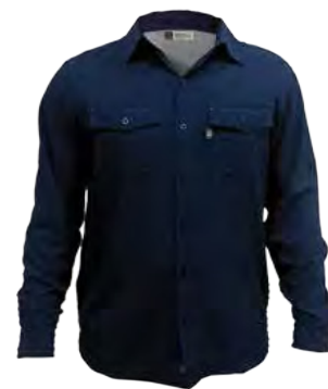
534 DEMIN BLUE