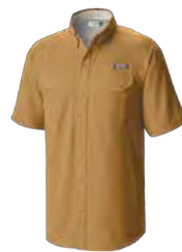
743 CANYON SUN