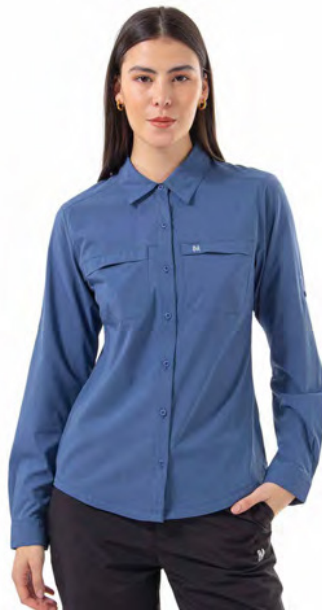
DARK MOUNTAIN 478