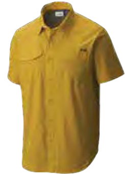
743 CANYON SUN