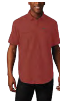
849 WARP RED