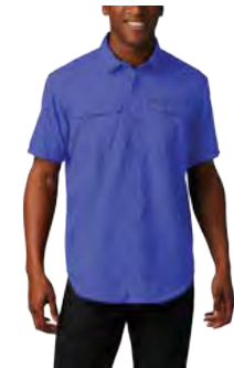
543 VIOLETA SEA