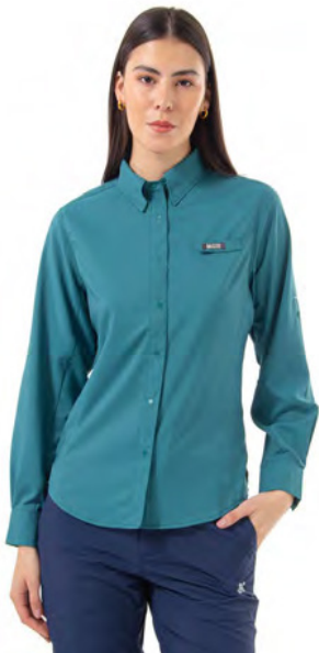
TRANQUIL TEAL 329