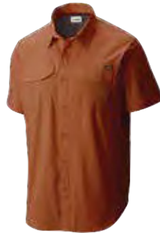
849 DESERT ORANGE