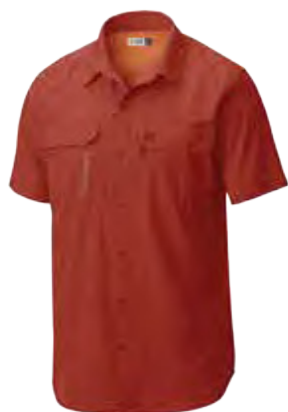
683 SUNSET RED