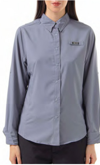
CITY GREY 023