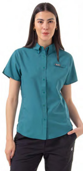
TRANQUIL TEAL 329