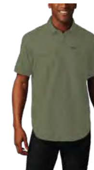
397 STONE GREEN