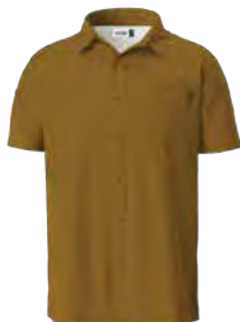
743 CANYON SUN