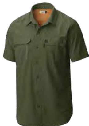
397 STONE GREEN