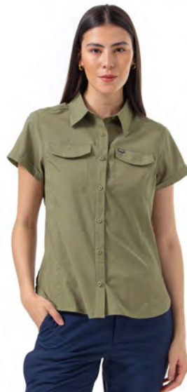
STONE GREEN 397