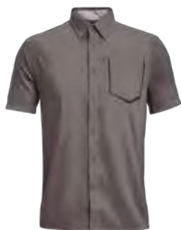
023 CITY GREY