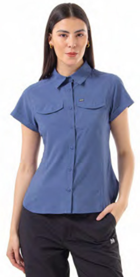
DARK MOUNTAIN 478