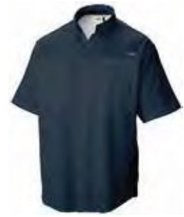
534 DEMIN BLUE