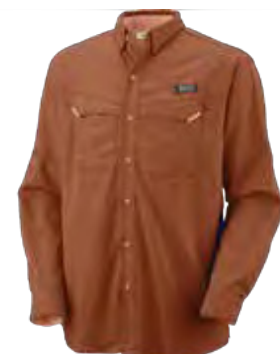
849 DESERT ORANGE