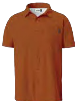
849 DESERT ORANGE