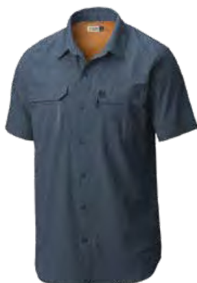
478 DARK MOUNTAIN