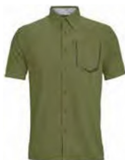
317 OUTDOOR GREEN