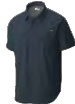
● 478 DARK MOUNTAIN