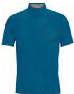
400 OCEAN TEAL