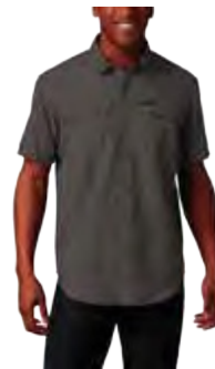
023 CITY GREY