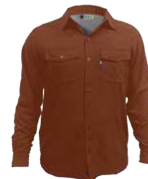
849 DESERT ORANGE