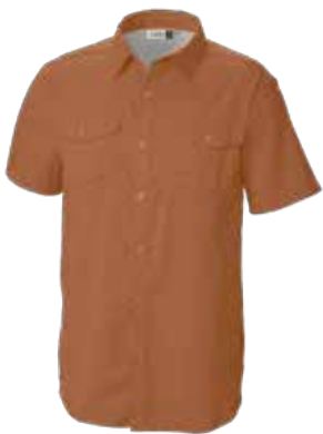
849 DESERT ORANGE