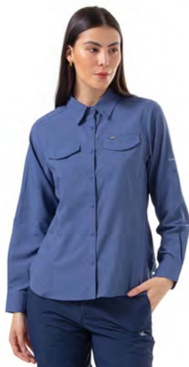
DARK MOUNTAIN 478