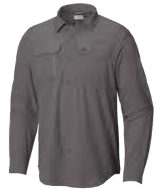
023 CITY GREY