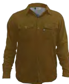
743 CANYON SUN