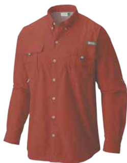
683 SUNSET RED