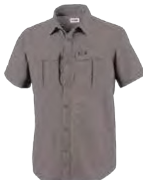
023 CITY GREY