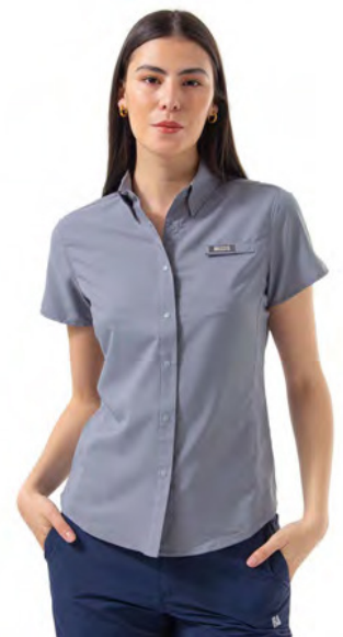
CITY GREY 023