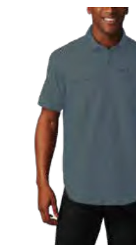
478 DARK MOUNTAIN