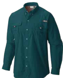
329 TRANQUIL TEAL