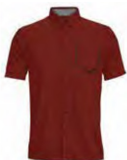
622 RED LILY