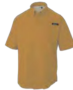
743 CANYON SUN