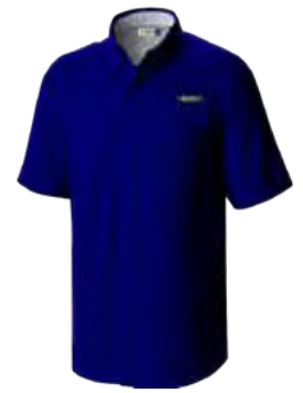
534 DEMIN BLUE