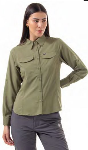
STONE GREEN 397