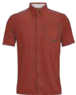
683 SUNSET RED